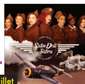
SATIN DOLL SISTERS