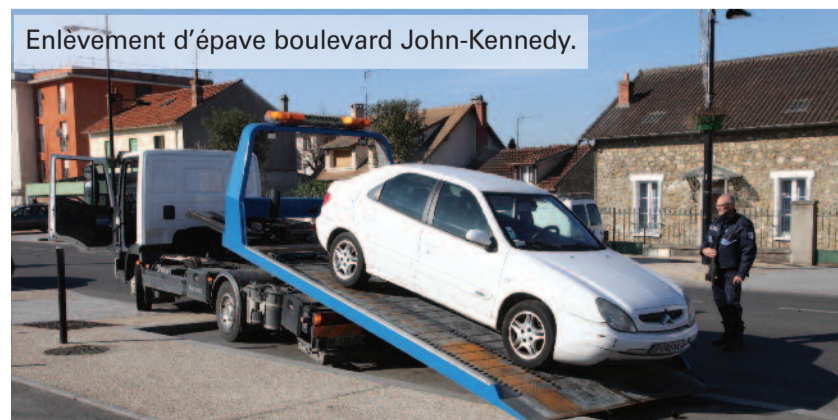
Enlèvement d'épave boulevard John-Kennedy.

L'abandon d'un véhicule est un problème de sécurité publique. Les règles de circulation s'appliquent également à ces véhicules abandonnés. Il est donc important de les enlever pour éviter les accidents et les incendies. Le préfet de l'Essonne a lancé une opération de nettoyage des rues. Les véhicules abandonnés sont enlevés et détruits. Cette action a permis de réduire de moitié le nombre de véhicules abandonnés dans les rues de Corbeil-Essonnes.