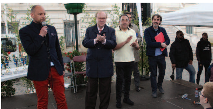
Le Maire a félicité les participants au raid de Corbeil-Essonnes, une course citoyenne organisée par la direction de la jeunesse et des sports qui permet aux jeunes, de 10 à 13 ans, de découvrir une vingtaine de structures sur la ville.