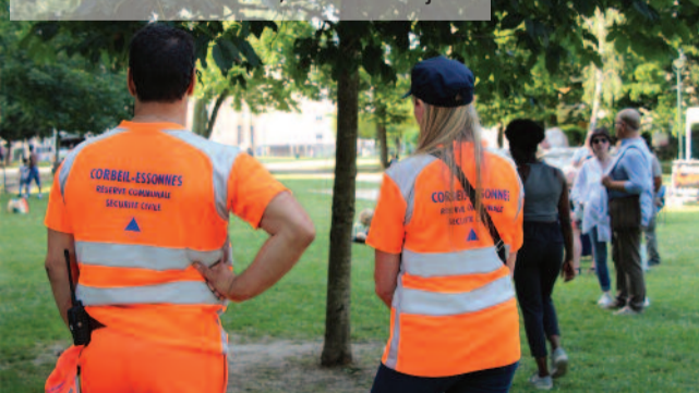
Réserve communale, festival de jazz.