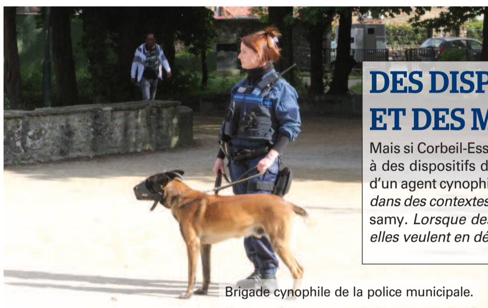
Brigade cynophile de la police municipale.

« aujourd'hui nous tous les halls d'im- pers. Ainsi, nous per- gade spécialisée de des B.A.C. dont les pour et de nuit pour bénéficie aussi d'un et qui sanctionnent bons résultats sont t rendus beaucoup s de véhicules et de des n'ont pas com- euve s'il en est que