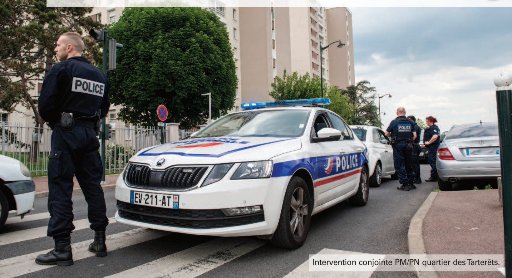
Intervention conjointe PM/PN quartier des Tarterêts.

La sécurité est la pre Il n'y a pas de liberté et sans la garantie q cette déclaration de associe ses efforts publique. Ce dossier et pas toujours bien place pour lutter effi s'agit d'une lutte au chaines années. Exp