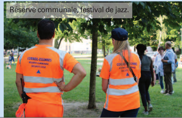
Réservé communale, festival de jazz.

La ville a mis en place depuis 2010, en collaboration avec la police municipale, un service dédié à la sécurité des bâtiments. 11 agents formés à la sécurité des personnes et à la sécurité incendie préviennent contre les intrusions, assurent l'ouverture et la fermeture des bâtiments. Ils participent à l'accueil dans les bâtiments municipaux recevant du public grâce à leurs compétences en matière de médiation.