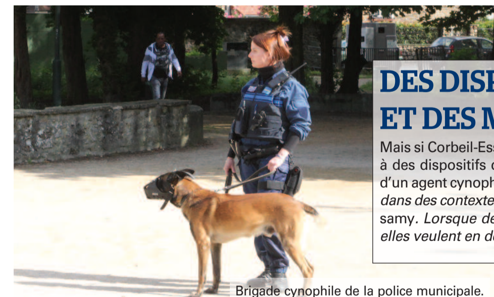
Brigade cynophile de la police municipale.

Mais si Corbeil-Essonnes est une ville plus sûre, c'est aussi grâce à des dispositifs dissuasifs. La police municipale dispose ainsi d'un agent cynophile. « Sa présence permet d'apaiser la situation dans des contextes parfois difficiles, souligne Jean-Yves Mootosamy. Lorsque des personnes sont en état d'ébriété ou quand elles veulent en découdre. »