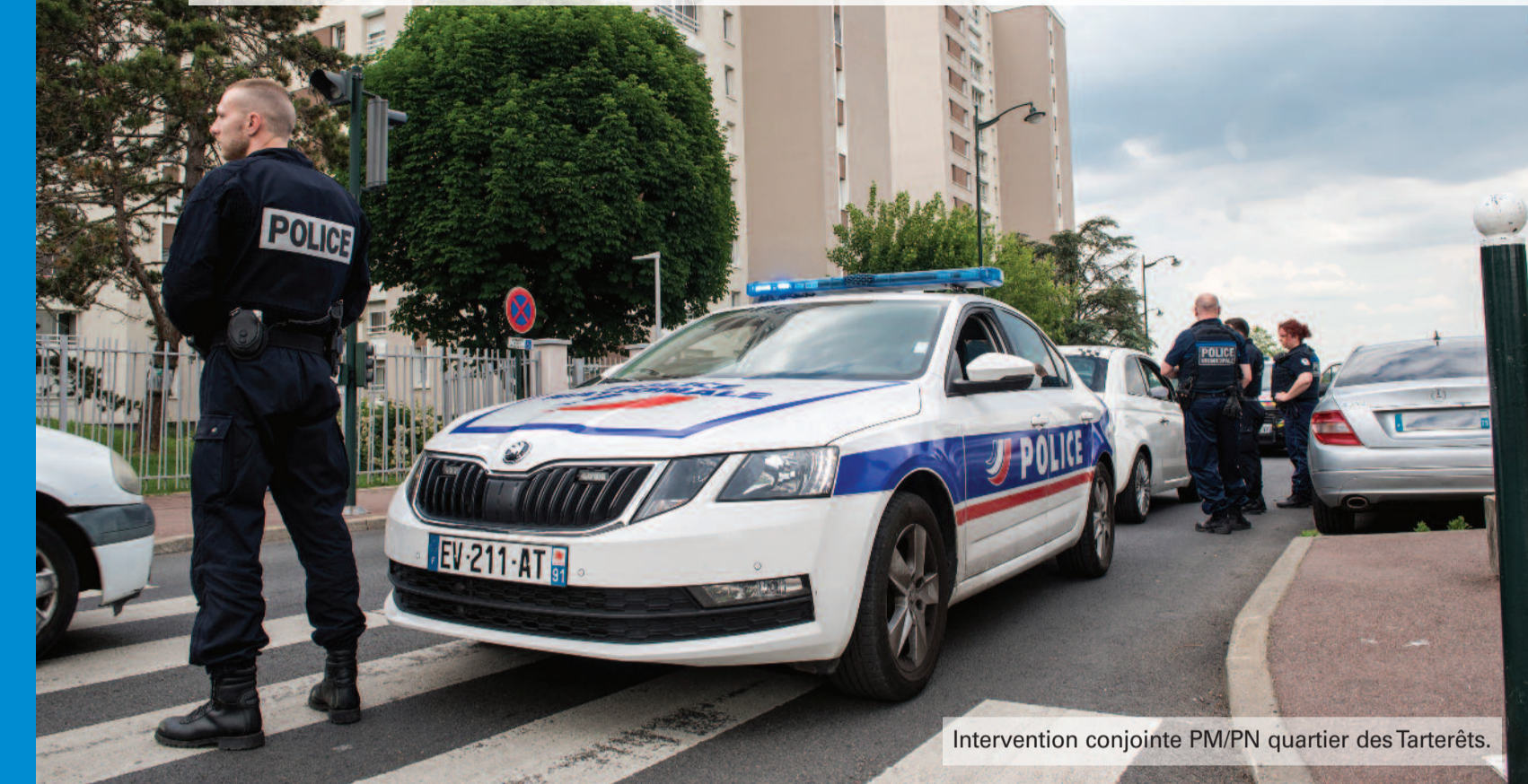
Intervention conjointe PM/PN quartier des Tarterêts.