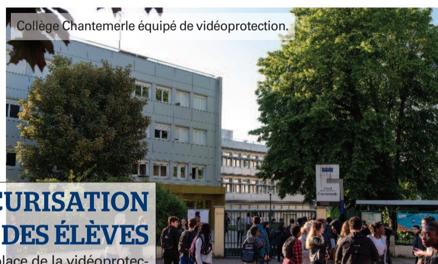
Collège Chantemerle équipé de vidéoprotection.