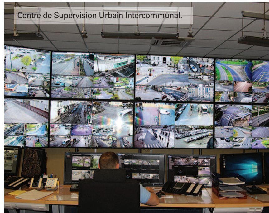
Centre de Supervision Urbain Intercommunal.