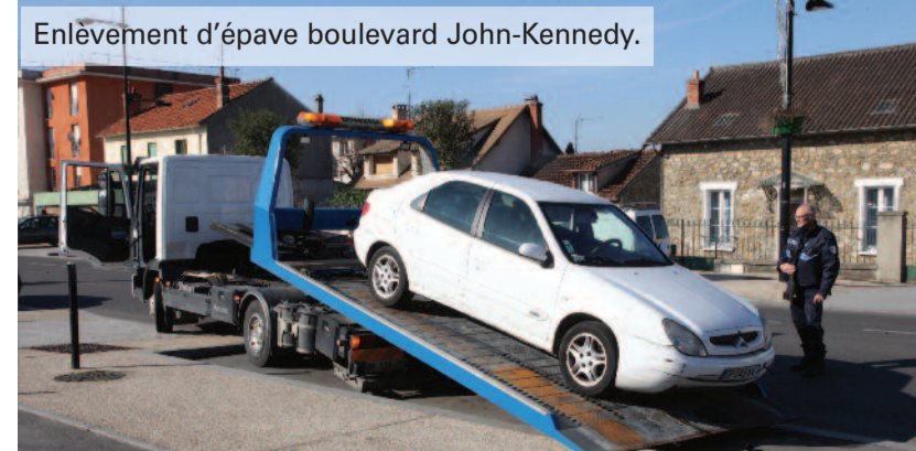
Enlèvement d'épave boulevard John-Kennedy.

L'abandon de véhicules sur la voie publique constitue un réel problème de sécurité publique car ils deviennent des épaves potentiellement dangereuses. Pour y remédier, la police municipale applique les règles du code de la route : un stationnement abusif de plus de 7 jours entraîne une mise en fourrière suivie, dans un délai de 45 jours et en fonction de la valeur vénale du véhicule (elle doit être inférieure ou égale à 750 €), d'une destruction. Si le propriétaire peut être retrouvé, il devra rembourser la ville. Une situation qu'il est facilement possible d'éviter, puisque la police municipale peut prendre en charge gratuitement la destruction d'un véhicule si elle est demandée par le propriétaire. Un service proposé après constitution d'un dossier administratif effectué sur place du lundi au vendredi de 9h à 17h.