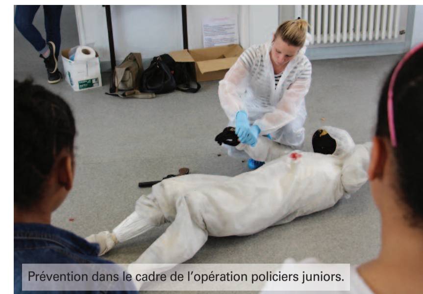
Prévention dans le cadre de l'opération policiers juniors.