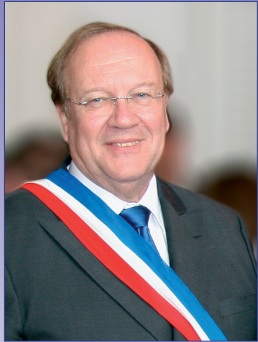
Jean-Pierre BECHTER Maire de Corbeil-Essonnes