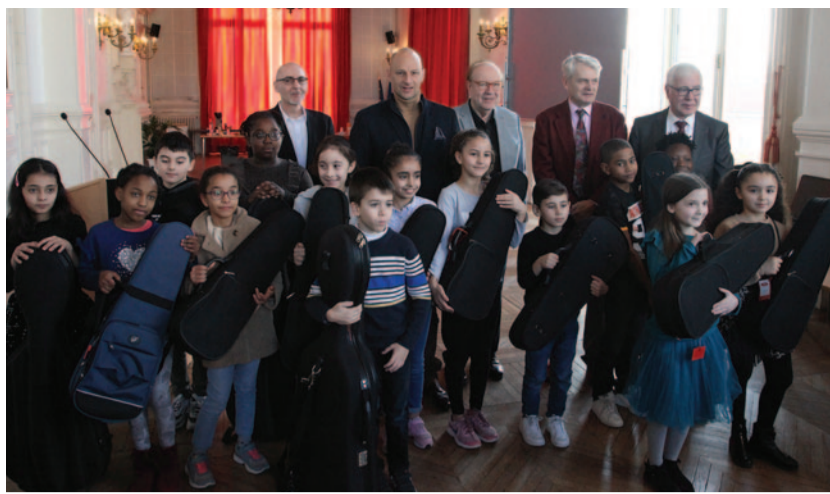
Salle du conseil, à l'Hôtel de ville, une quinzaine de jeunes a reçu le 18 janvier, des instruments de musique dans le cadre du projet Demos.