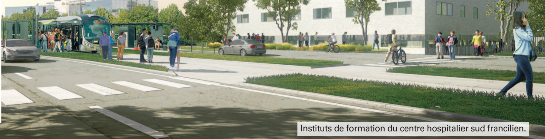
Instituts de formation du centre hospitalier sud francilien.