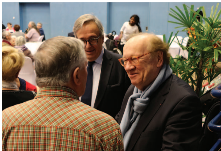
Du 27 au 29 janvier, les seniors ont passé une journée de détente autour d'un repas gastronomique et de musiques des années 60 à 80, au Palais des sports.