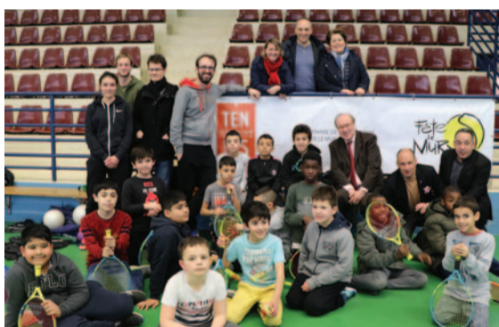
L'ASCE Tennis a accueilli des jeunes et des élus pour sa journée festive « Fête le mur » le 11 janvier.