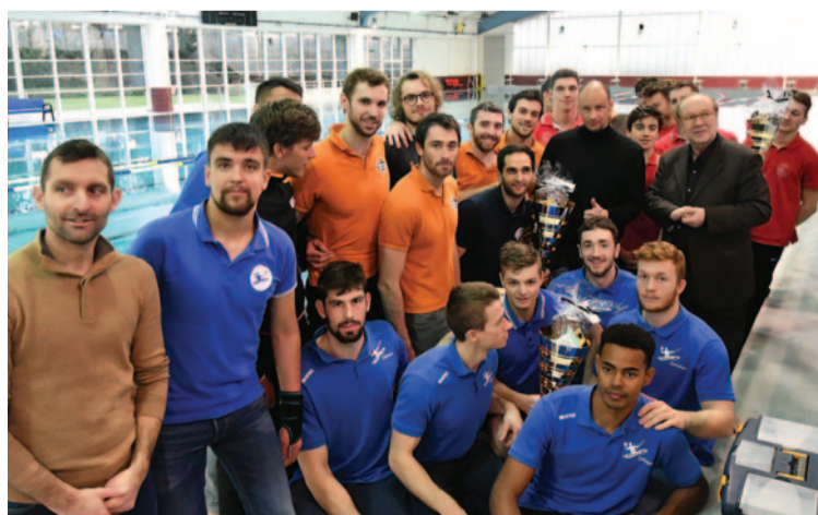
Les finales du tournoi national de kayak-polo du 12 janvier ont rassemblé un public nombreux au stade nautique Gabriel-Menut.