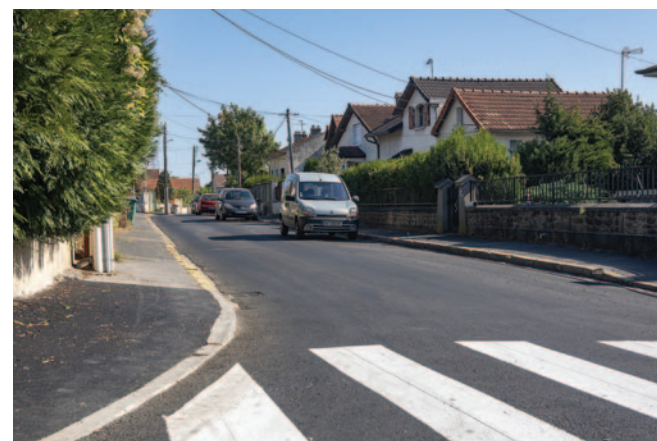
Rue de l'Alouette.