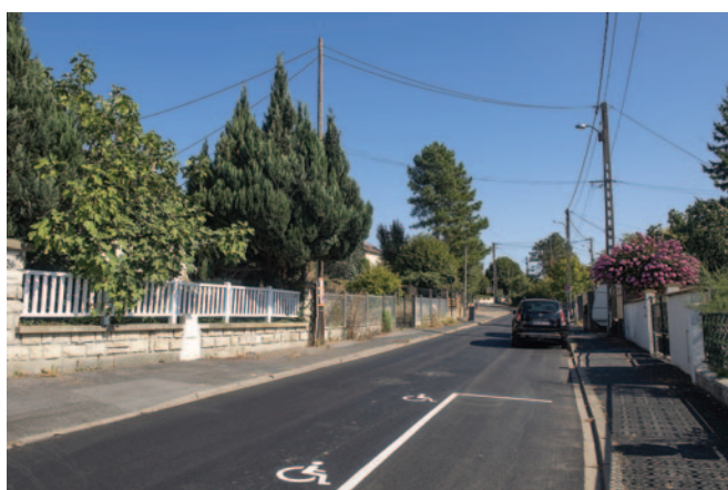
Chemin des Longaines.