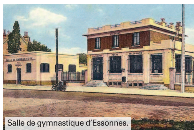
Salle de gymnastique d'Essonnes.