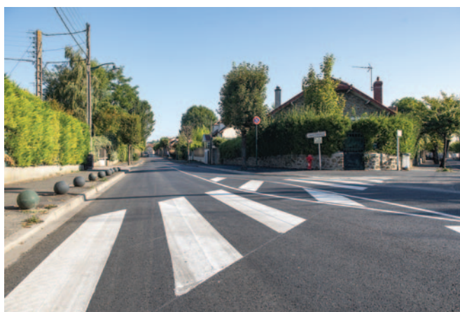
Rue d'Alsace Lorraine.

La Ville a inscrit au budget la réfection de voiries. Plusieurs rue de Corbeil-Essonnes ont fait l'objet de la pose d'enrobés bitumeux.