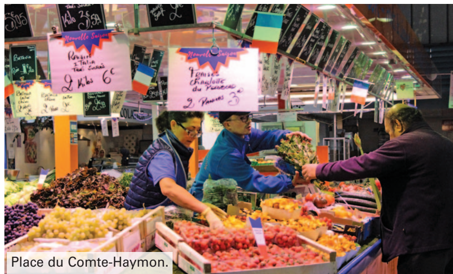
Place du Comte-Haymon.

Les habitudes de consommation des Corbeil-Essonnois évoluent. L'offre commerciale s'adapte donc sur les marchés, présents 6 jours par semaine, en Centre ville, aux Tarterêts et à Essonnes, avec l'accueil de nouveaux commerçants et une modification des amplitudes horaires afin de permettre une fréquentation par les habitants et salariés de la Commune.