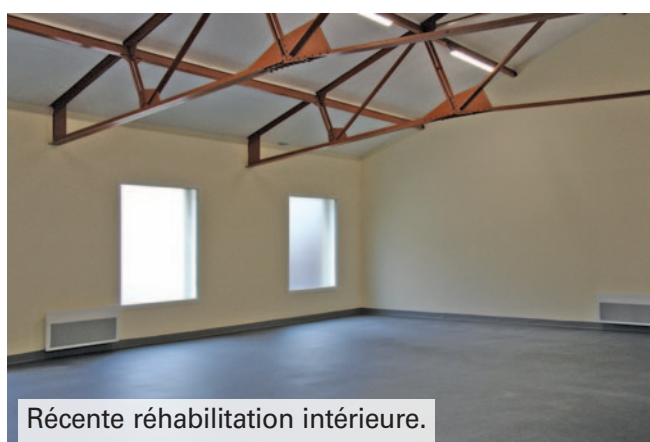
Récente réhabilitation intérieure.

Durant l'été, l'annexe du Palais des sports située 9 rue Paul-Doumer a été entièrement réhabilitée. À cette occasion, le bâtiment a repris le nom initial de "salle de gymnastique d'Essonnes" et accueille dans des locaux neufs, les sportifs pour la pratique de la Capoeira, la gymnastique rythmique, le karaté, le karaté body, et la zumba.