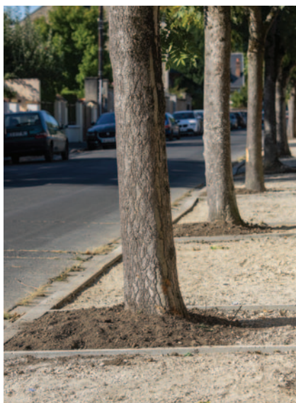
Rue Jeanne D'Arc.