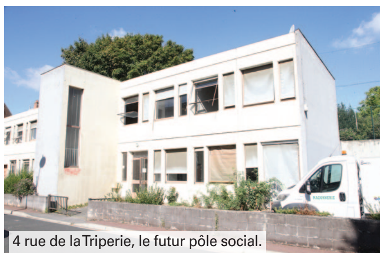
4 rue de la Triperie, le futur pôle social.

Afin de mieux accueillir les Corbeil-Essonnois et de faciliter les démarches concernant les différents dispositifs d'aide sociale, la ville ouvre un pôle social dans les anciens locaux du CIO situés 4 rue de la Triperie. Il regroupera ainsi le CCAS, la mission handicap et la mission famille.