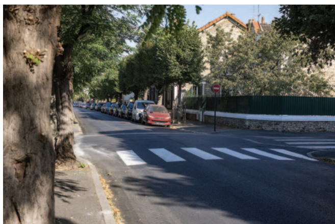
Rue du champs d'Épreuves.