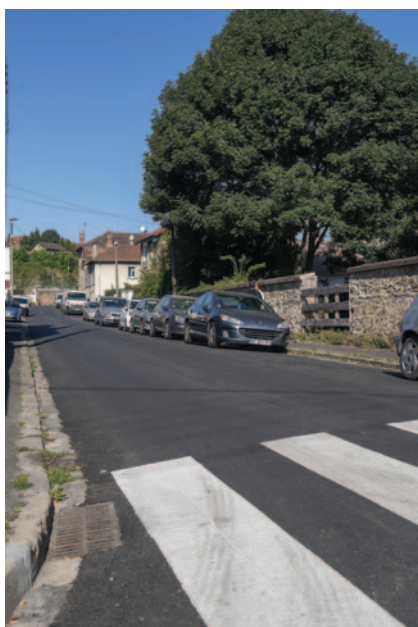
Rue de l'Indienne.