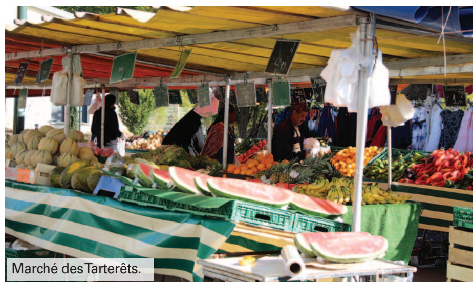
Marché des Tarterêts.

Place du Comte-Haymon, en plein cœur historique, depuis le jeudi 19 septembre 2019, découvrez de nouveaux commerçants alimentaires mais pas que : traiteur, primeur, fromager, poissonnier, prêt-à-porter, décoration, ustensiles de cuisine, vous y attendent. « C'est une bonne idée ce marché, ça va aider à redynamiser le centre ville » peut-on entendre. Tous les jeudis à la sortie du travail ou en regagnant votre domicile, vous pourrez bénéficier de produits sains, frais et ainsi vous préparer de bons petits plats ! Afin de faciliter la circulation et le stationnement, le parking reste, en grande partie, accessible aux véhicules.