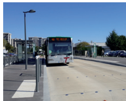
▲ Grigny, rue Saint Exupéry, site propre pour les bus.

Elle a été réalisée dans le cadre la ZAC du Centre Ville de Grigny. D'ici la mise en service du T Zen 4, la ligne 402 empruntera cette voie réservée.