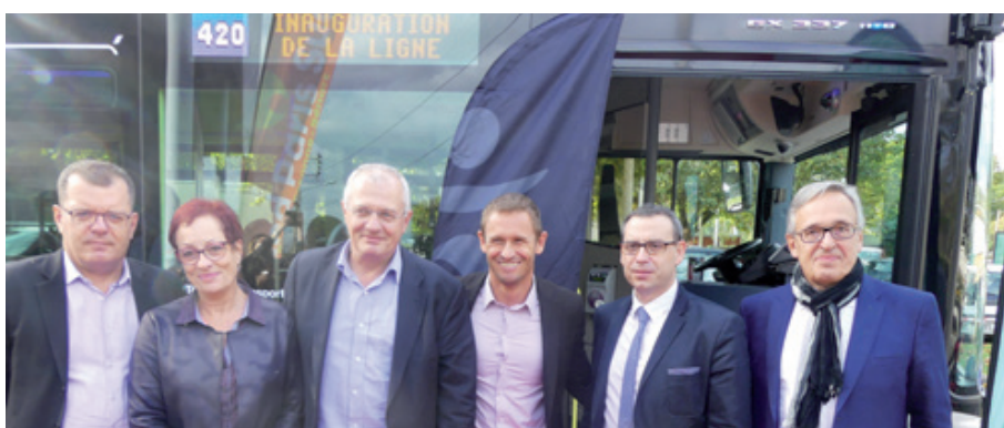
▲ Inauguration de la ligne 420, en présence des acteurs du territoire