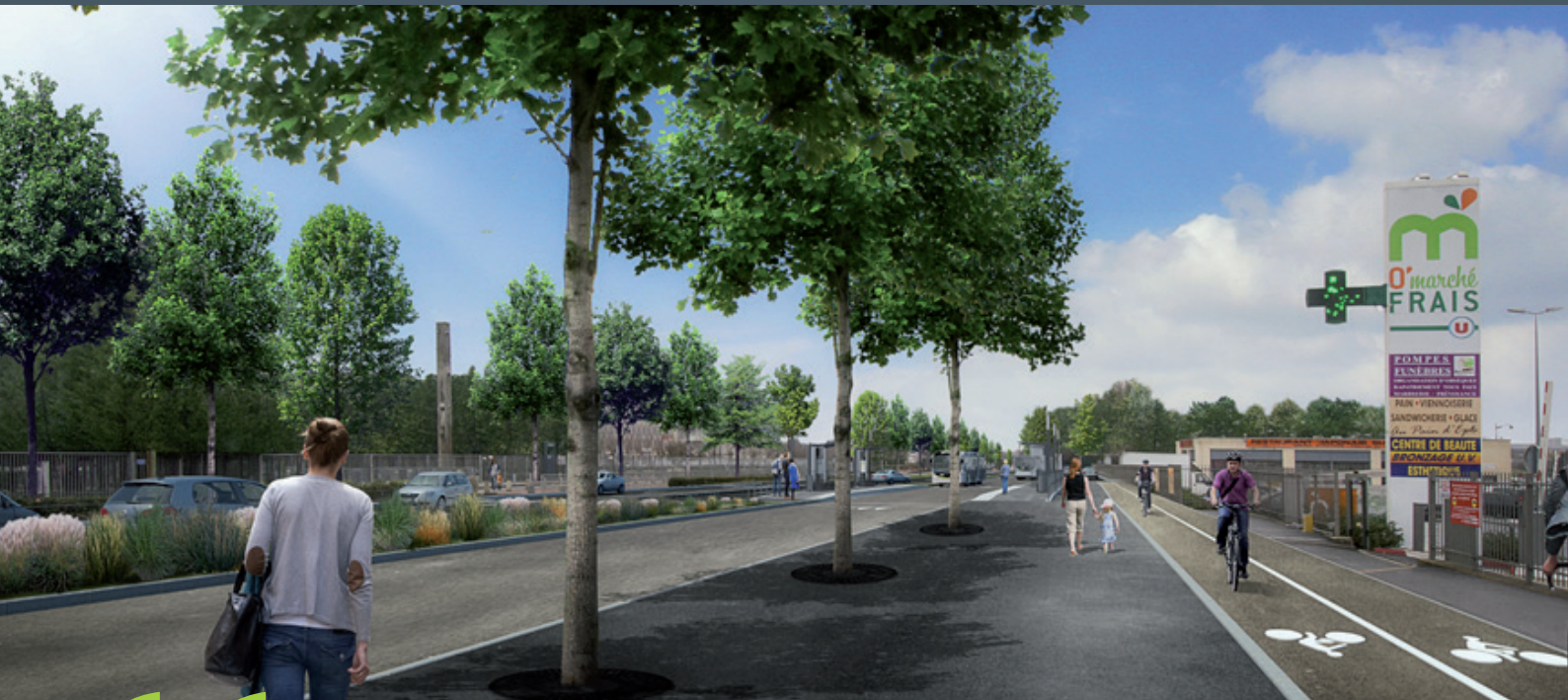
▲ Corbeil-Essonnes-RN 7, site propre du T Zen 4, image non contractuelle