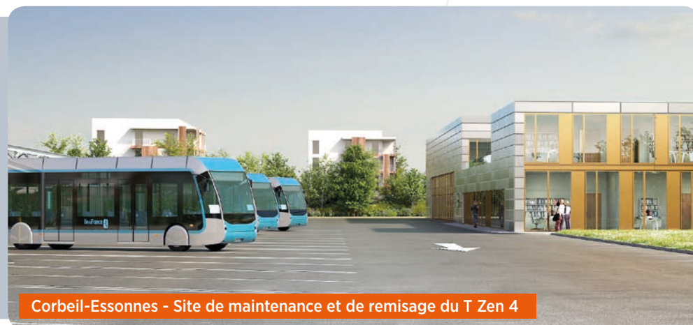
Corbeil-Essonnes - Site de maintenance et de remisage du T Zen 4

Le site de maintenance et de remisage (SMR) permettra d'assurer l'entretien, le nettoyage et le stationnement des futurs bus T Zen 4. Il sera construit sur l'ancien site logistique Norbert Dentressangle, à Corbeil-Essonnes. Île-de-France Mobilités et les financeurs souhaitent être exemplaires dans la performance environnementale du site et de ce nouveau bâtiment et veilleront à sa bonne intégration dans son environnement urbain.