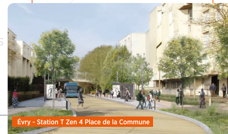
Évry - Station T Zen 4 Place de la Commune

Par ailleurs, une des recommandations de la commission d'enquête portait sur l'insertion de la station « Place de la Commune ». La position de la station a donc été revue afin de ne pas empiéter sur des espaces privés.