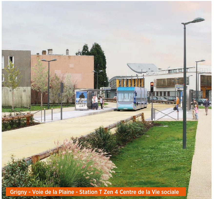
Grigny - Voie de la Plaine - Station T Zen 4 Centre de la Vie sociale

L' approbation de l'avant-projet (AVP) marque l'entrée du Bus T Zen 4 dans une phase opérationnelle. C'est un document qui détaille de façon précise l'ensemble des caractéristiques techniques du projet : implantation des voies de bus, des chaussées, des bandes cyclables, des trottoirs, des places de stationnement, des arbres, etc. Il intègre aussi les engagements pris par Île-de-France Mobilités par rapport aux recommandations formulées par la commission d'enquête suite à l'enquête publique de 2016.