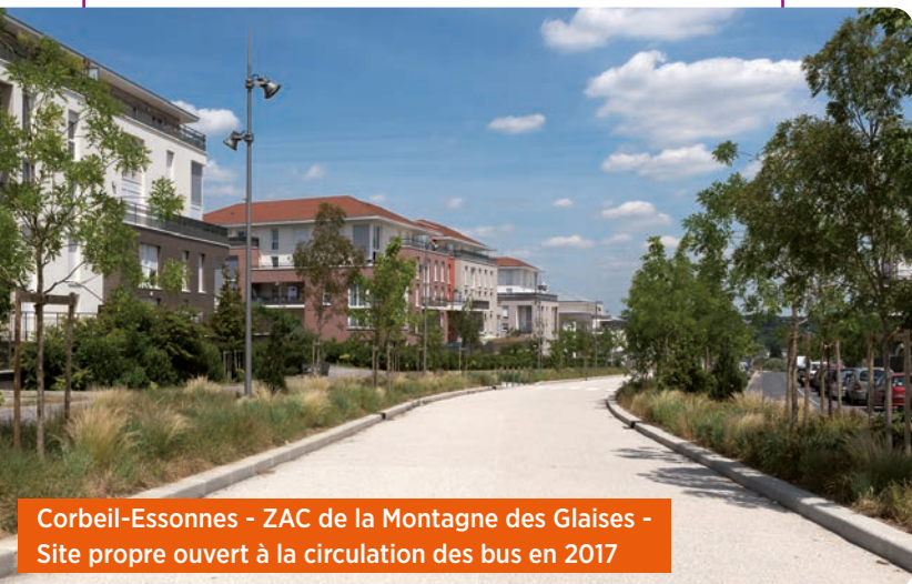
Corbeil-Essonnes - ZAC de la Montagne des Glaises - Site propre ouvert à la circulation des bus en 2017

Certaines portions du site propre du Bus T Zen 4 ont déjà été réalisées dans le cadre de projets urbains. C'est le cas pour la traversée du quartier de la Grande Borne et de la ZAC Cœur de Ville à Grigny, la desserte du Centre Hospitalier Sud-Francilien et celle du nouveau quartier de la Montagne des Glaises à Corbeil-Essonnes. Sur ces sections, les travaux porteront notamment sur les stations pour les adapter aux nouveaux Bus T Zen 4.