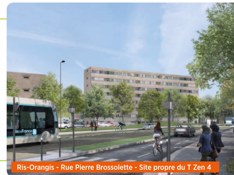
Ris-Orangis - Rue Pierre Brossolette - Site propre du T Zen 4

Entre la rue du Château d'eau et la rue de la Fontaine à Ris-Orangis, le bus T Zen 4 sera mêlé à la circulation générale, les rues étant trop étroites pour créer un site propre dédié.